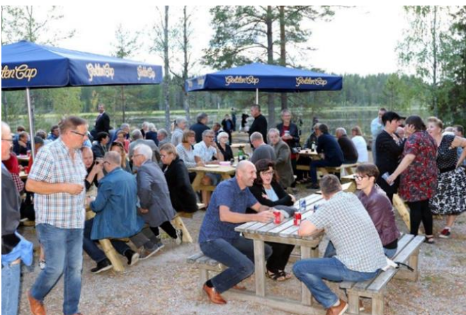
Viinin- ja viihteen iltaa vietettiin 18.8. Aulavalla. Järjestelyt hoidettiin yhteistyössä Yrittäjien kanssa.