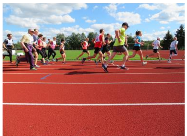
Kuula hölkkä juostiin lauantaipäivänä 18.8. Alavuden keskusurheilukentällä. Tapahtuma järjestettiin yhteistyössä Alavuden Urheiljoitten kanssa.