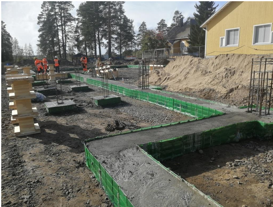
Tuurin koulun/päiväkodin urakkasopimukset allekirjoitettiin 28.6. ja rakennustyöt saatiin alkuun. Kuvassa laajennuksen anturan valutyöt käynnissä.

Vesihuollossa vuoden työt ovat aika pitkälle tehty.