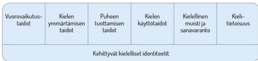
Kuvio 1. Lasten kielen kehityksen keskeiset osa-alueet varhaiskasvatuksessa (VASU 2018, 41).

Kielen oppimisen kannalta on tärkeää tiedostaa, että saman ikäiset lapset voivat olla eri vaiheissa kielen kehityksen eri osa-alueilla. Kielelliset identiteetit kehittyvät, kun lapsia ohjataan ja tuetaan kielellisten taitojen ja valmiuksien keskeisillä osa-alueilla. 6